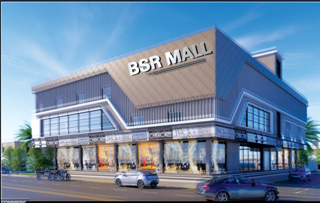
SHOPPING COMPLEX AND FUNCTION HALL